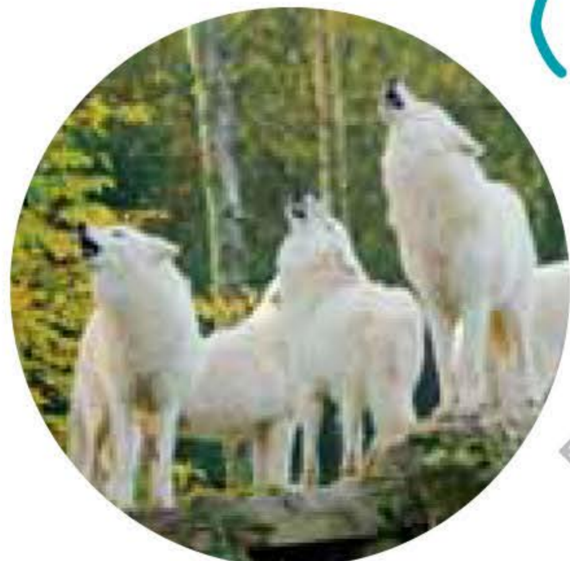
DOMAINE SAINTE-CROIX Parque zoológico