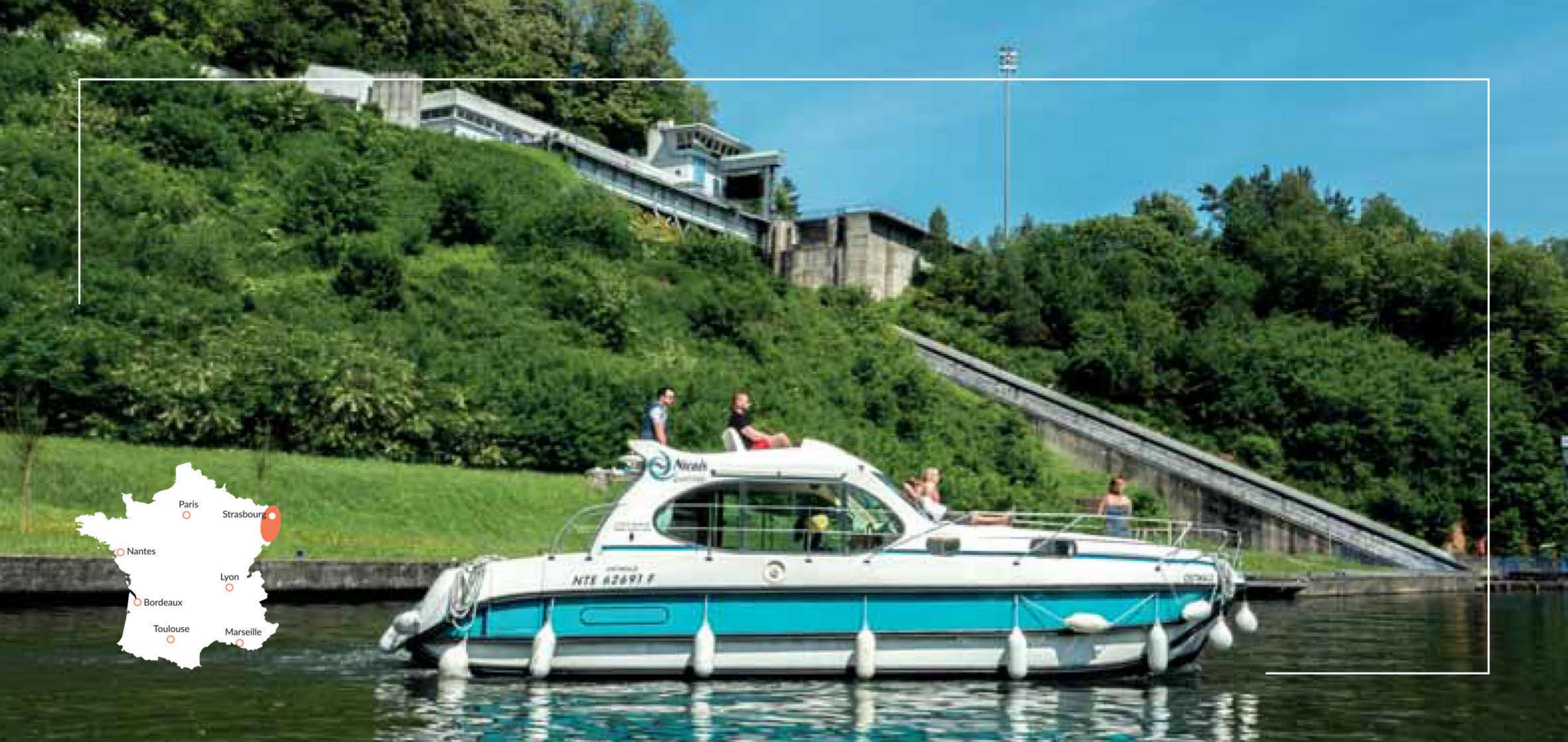
ARZVILLER - Plano inclinado