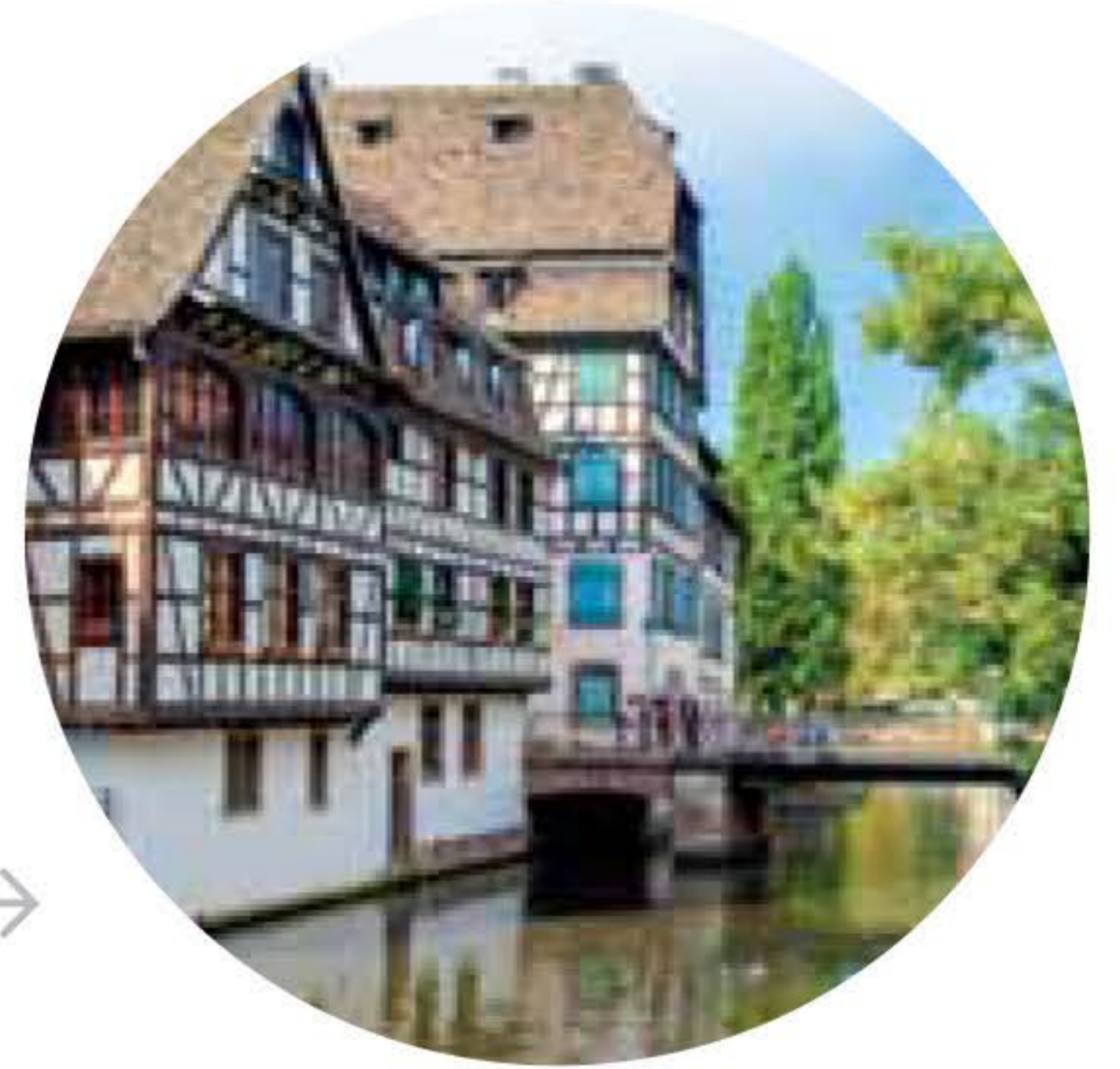
STRASBOURG La Petite France