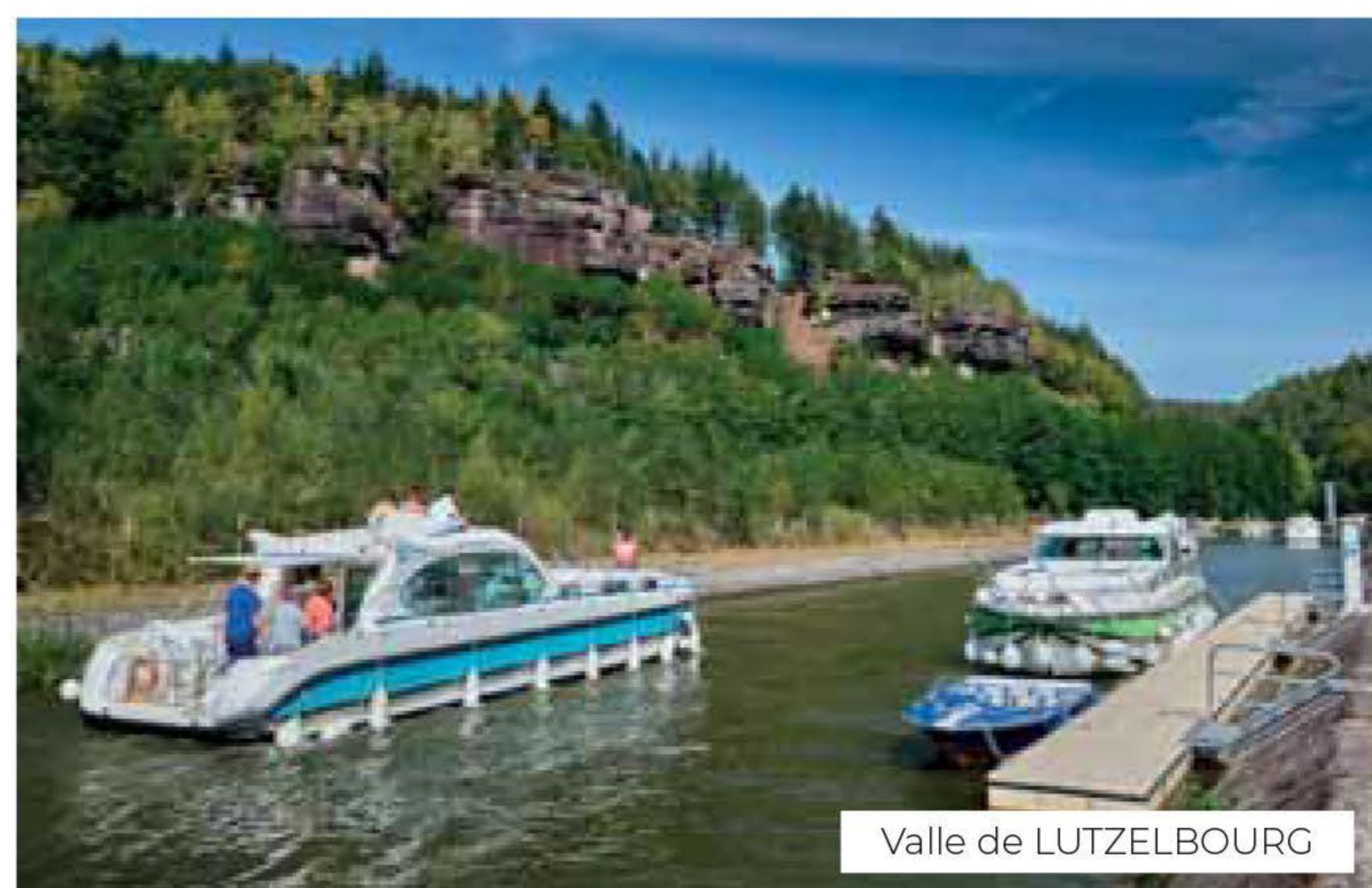
Valle de LUTZELBOURG

EXCLUSIVO: el Sixto® Green y el Quattro® Fly C Green son los primeros barcos con propulsión eléctrica (ver información en las página 48 y 51).